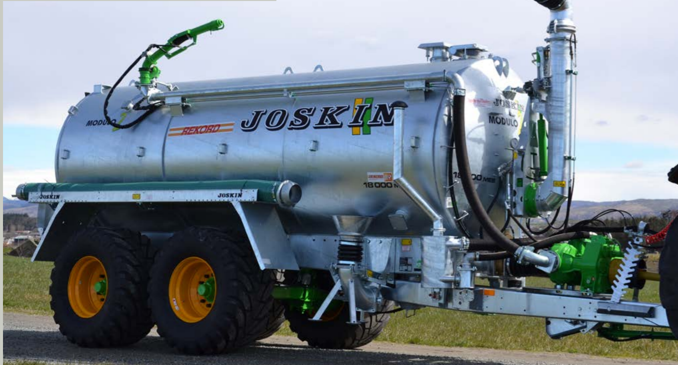
Anleggsvogn: Vogna går inne på Norstone på Tau til spyling av fjell/masseuttak og støvdemping.