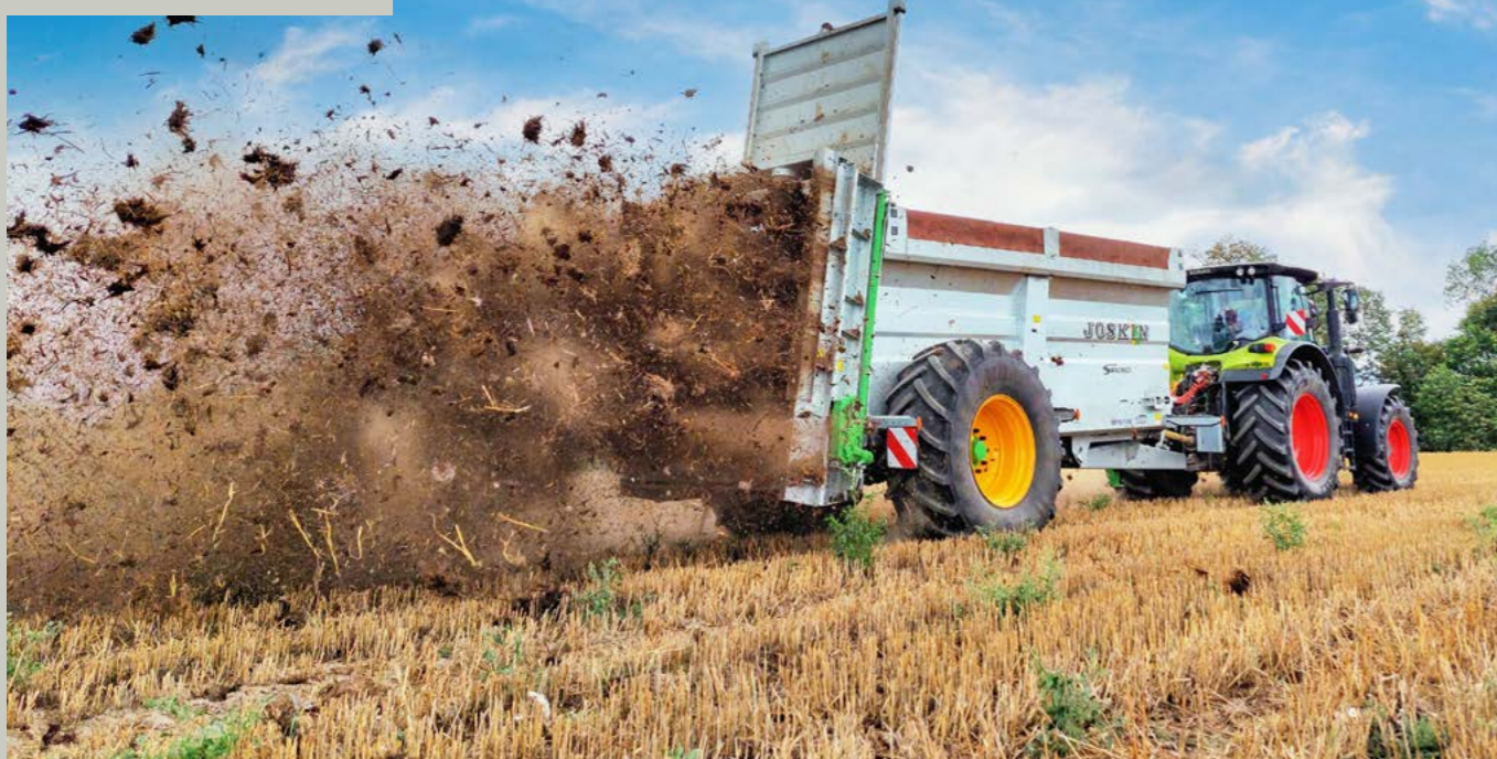
Joskin Siroko tørrgjødselspreder